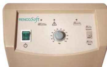
Abb. 1: Gehäuse Frontansicht

Das Pumpaggregat ist in einem Kunststoffgehäuse untergebracht. Den Hauptschalter „Ein/Aus“ finden sie links auf der Frontseite des Gehäuses. In der Mitte ist der Drehregler zur Einstellung des Patientengewichtes. Rechts befindet sich der Statikschalter. Darüber befinden sich die Kontrollleuchten „In Betrieb“ (grün) und „Niederdruck“ (rot). An der rechten Seite sind die Schnellkupplungen für die Schlauchanschlüsse der Matratzenauflage angebracht. An der Rückseite des Gehäuses befinden sich die Haken zur Aufhängung an das Patientenbett.