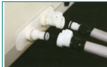
Abb. 3:CPR -Konnektoren

Für einen Standortwechsel des Bettes muss der Hauptschalter ausgeschaltet, die beiden CPC -Konnektoren sollten ineinander gesteckt werden und das Netzanschlusskabel aus der Steckdose gezogen werden. Das Bett kann zu einem neuen Standort gebracht werden, wo das Pumpaggregat an die nächste Steckdose angeschlossen und der Hauptschalter wieder eingeschaltet werden muss.